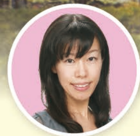
rfc 山地 美紗子 アナウンサー